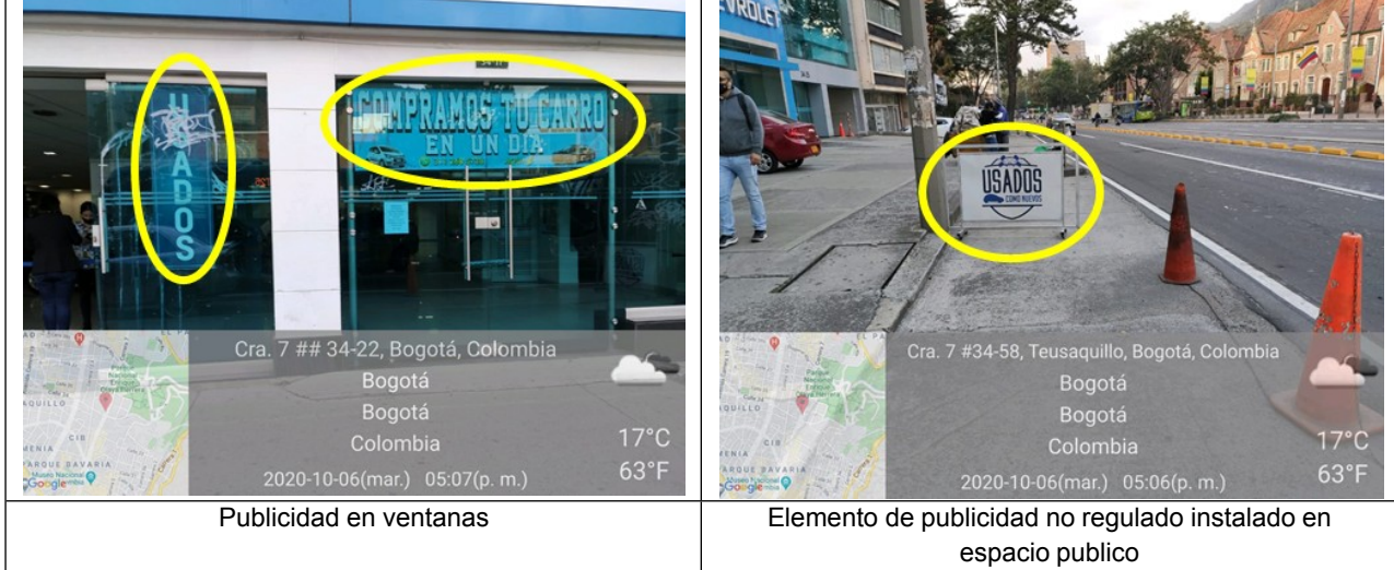
Fotografía No. 5